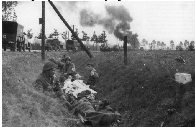
"Hell's Highway", 19 september 1944.

Vi fortsätter i bussen på "Hell's Highway" till hotellet i Nijmegen.