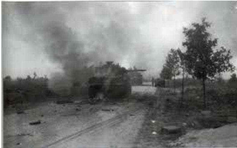
Denna stridsvagn var en av flera som slogs ut vid det tyska eldöverfallet mot XXX kårens pansarkolonn den 17 september 1944. På krigskyrkogården vilar en besättningsmedlem som Christer Bergström kommer att berätta om.

Kl 10.00 Vi fortsätter i bussen i XXX kårens spår till den brittiska krigskyrkogården söder om Valkenswaard, på demn plats där XXX kåren gjorde halt den 17 september 1944. Här gör även vi ett uppehåll och besöker krigskyrkogården. Christer Bergström kommer att förevisa några gravar och berätta om de personer som vilar där.