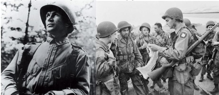
Mark Gavin, den hårdföre chefen för amerikanska 82. luftburna divisionen "All American", samt några av hans män som stred i och omkring Nijmegen under operation Market Garden.