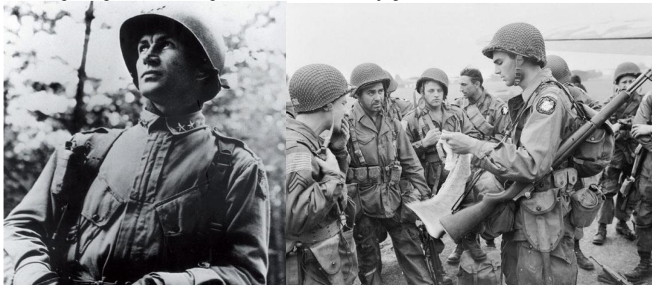
Mark Gavin, den hårdföre chefen för amerikanska 82. luftburna divisionen "All American", samt några av hans män som stred i och omkring Nijmegen under operation Market Garden.